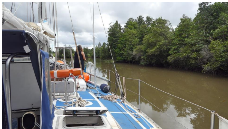
Figura 11: Su per il fiume

Ci ormeggiamo a una stretta passerella di legno accanto a un paio di edifici con un cortile erboso in mezzo: è il marina più grezzo mai visto finora, ma prendiamo accordi per ritrovarci qui fra una decina di giorni e lasciare la barca custodita fino alla prossima primavera.