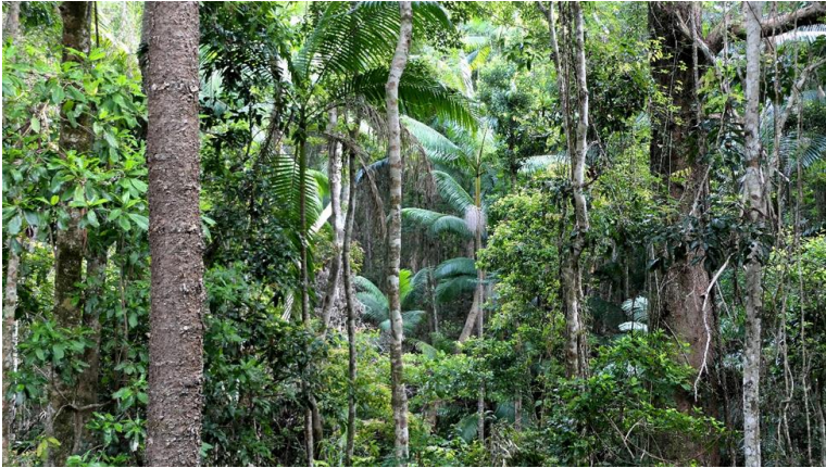
Figura 5: La fitta foresta di Frazer Island

tambucio da fare come il vecchio che il fabbro aveva come campione, curvo come il ponte, lo fa dritto come un biliardo anche la seconda volta! Alla terza ci riescono.