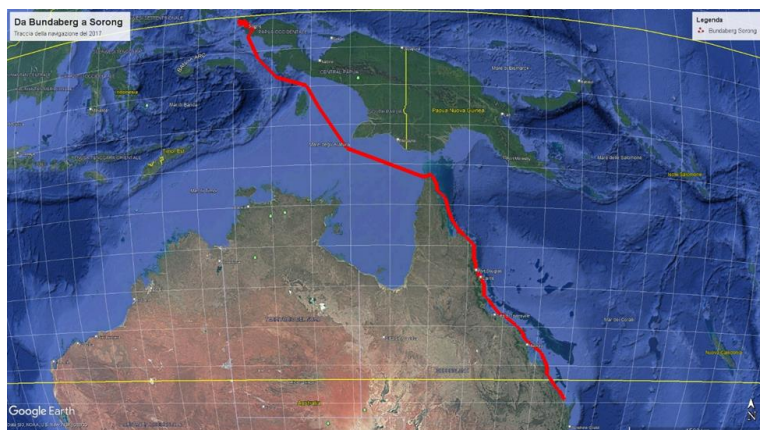
Figura 1: La traccia della navigazione del 2017