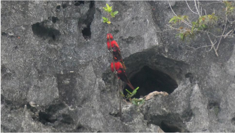
Figura 10: Due pappagalli colorati

arrampica svelto sul palo del radar e si infila nel foro in alto da cui escono i cavi delle antenne.