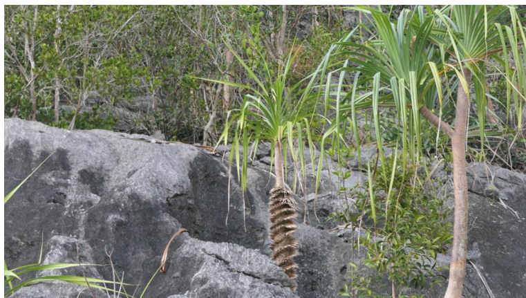
Figura 9: Flora attaccata alle rocce

Anche le pareti viste da vicino dal gommone sono affascinanti: ospitano pandani e altre piante che fanno da trespolo per uccelli coloratissimi.