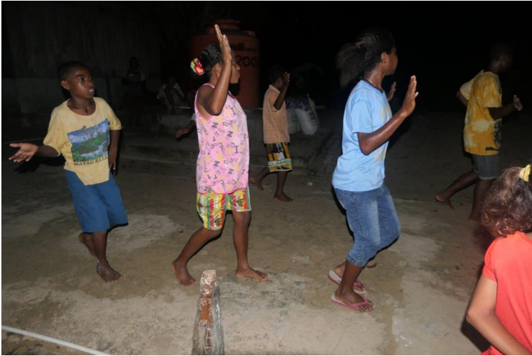
Figura 7: Danze notturne a Pulau Manyafun

Qui ogni lembo di terra è proprietà di una famiglia allargata a collaterali e discendenti e tutti devono dare il loro assenso per qualsiasi transazione.