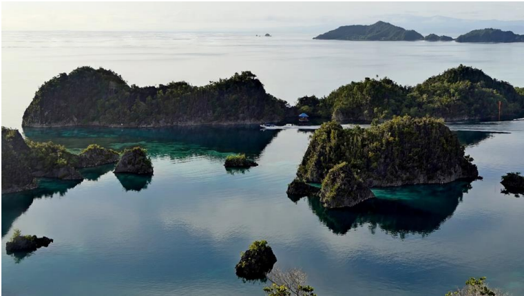
Figura 8: Panorama di Pulau Penemu

Chiesto e pagato il permesso, entriamo passando sotto a un cavo elettrico dall'altezza sconosciuta per ancorarci nel centro della laguna.