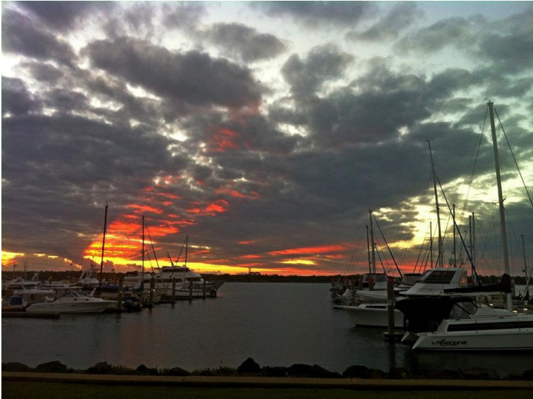
Figura 2: Spettacolosi raggi del sole al tramonto sul Marina di Bundaberg