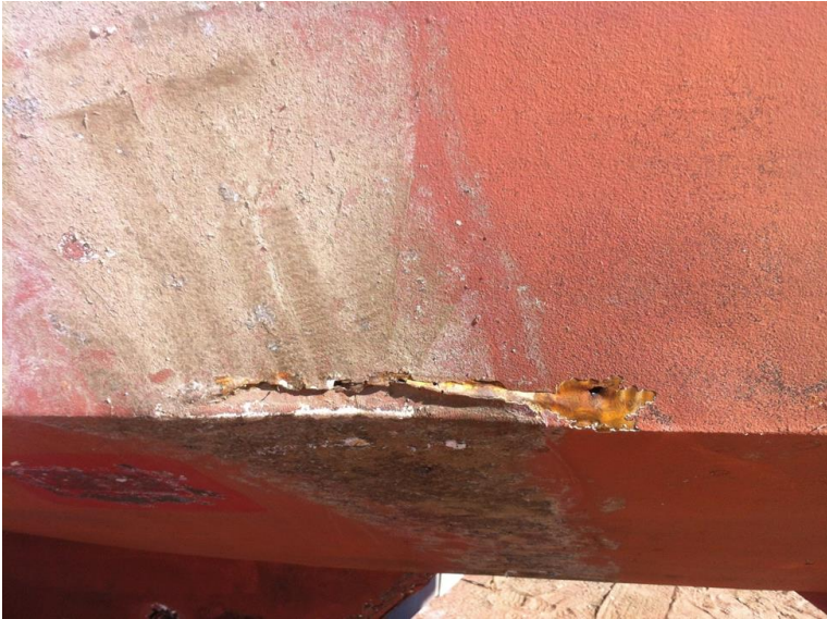
Figura 3: Il danno allo scafo