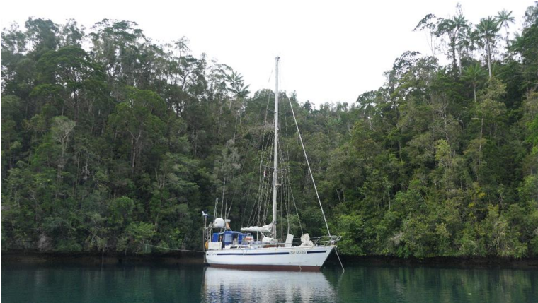
Figura 13: All'ancora a Gam

Vogliamo tornare nella zona di Gam che ci sembra of- fra migliori opportunità di sosta.