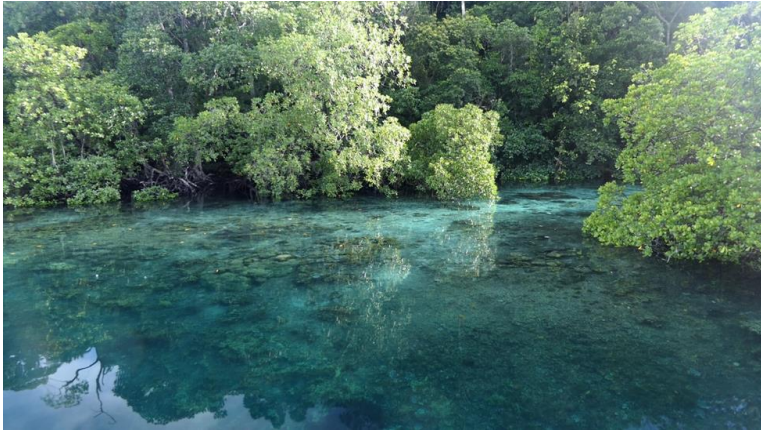
Figura 6: L'acqua cristallina dell'anfratto di Pulau Pef

del villaggio di Pulau Manyafun, dopo aver debitamente chiesto il permesso con l'aiuto del nostro amico indonesiano.