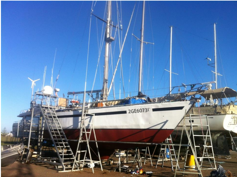
Figura 4: Best Explorer in cantiere

Cercherò di fare il massimo prima dell’arrivo di Nicoletta fra una quindicina di giorni.